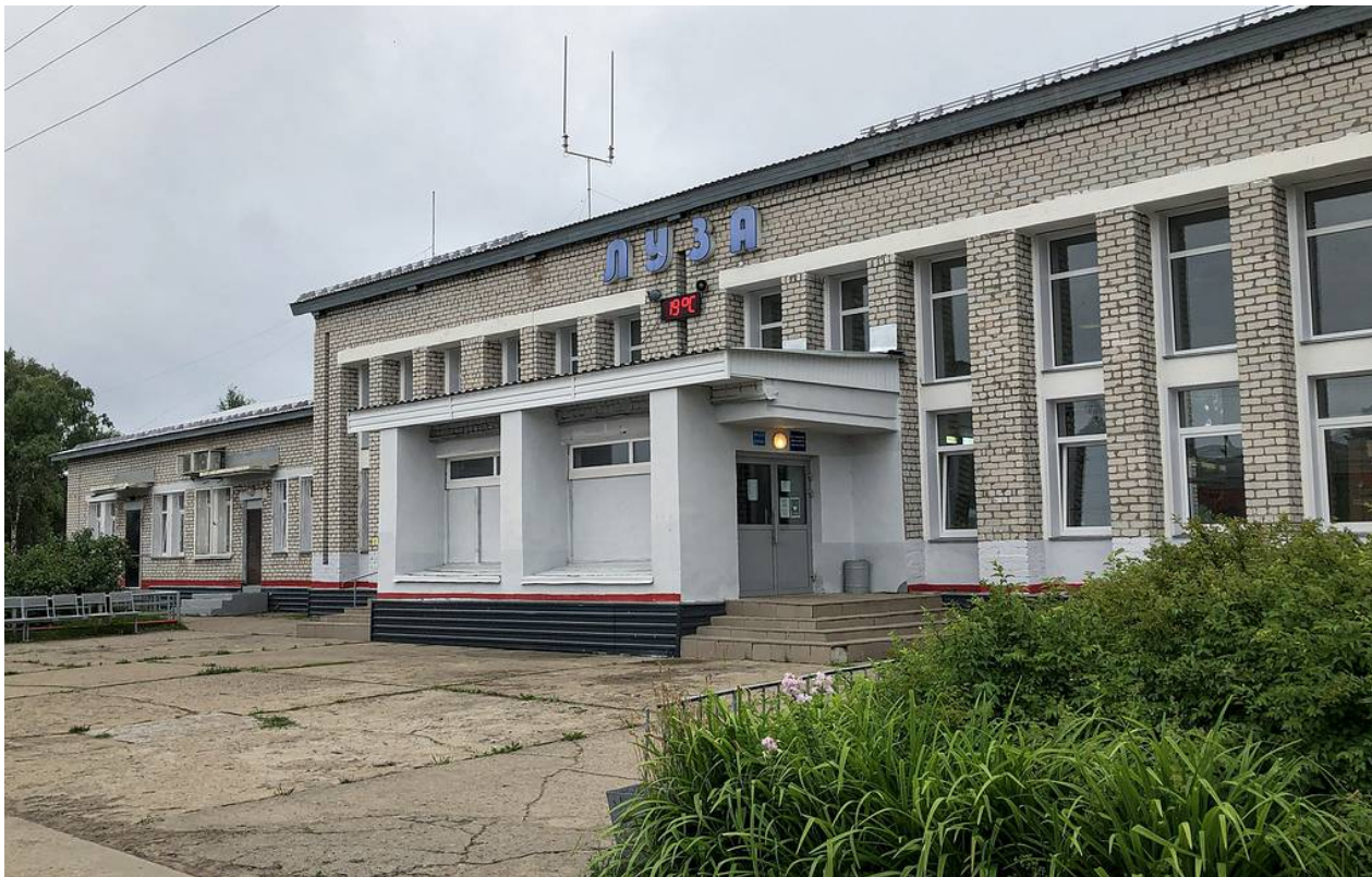
Железнодорожная станция Луза

И сильно прогадали. Новая железнодорожная станция Луза стала местом притяжения в этих краях. Прокладывали ее крестьяне из окрестных деревень, они же остались ее обслуживать. Вскоре подтянулись и купцы — завели здесь дома и торговые склады.